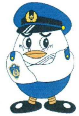
埼玉県警察マスコット 「ポッポくん」