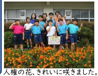
人権の花、きれいに咲きました。

【12月の予定】 12月 7日(土),8日(日)…八幡神社例大祭(5,6年歌舞伎披露) 9日(月)…振替休業日 18日(水),19日(木)…特4 13:00 下校 20日(金)…特4 給食終了 13:00 下校 23日(月)…特3 11:20 下校 24日(火)…特3 2学期終業式 11:20 下校