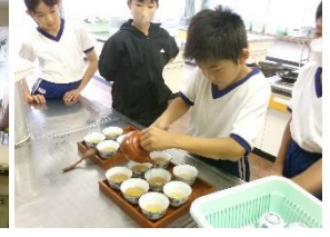
1、2、3、4年・出前授業（直売所、ふるさと両神、出浦園）