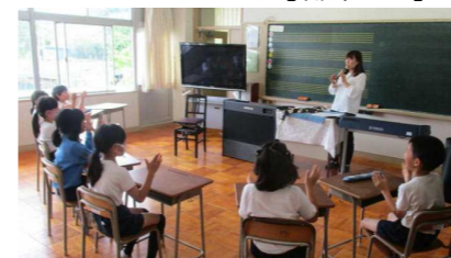
【リコーダー講習会】