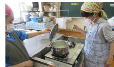
【初めての調理実習】